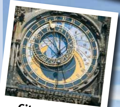
City & Kultur

Bitte beachten: Preise für Stadtrundgang oder Sonderführungen und Eintritte sind nicht inklusive. Die Details und mögliche Änderungen der Eintrittspreise teilen wir Euch im Rahmen der konkreten Programmabstimmung im Vorfeld mit. Selbstverständlich können wir für Euch auch eine oder mehrere Übernachtungen buchen: das ist unbedingt zu empfehlen, wenn Eure Anreisestrecke nach Prag länger als 250 Kilometer ist.